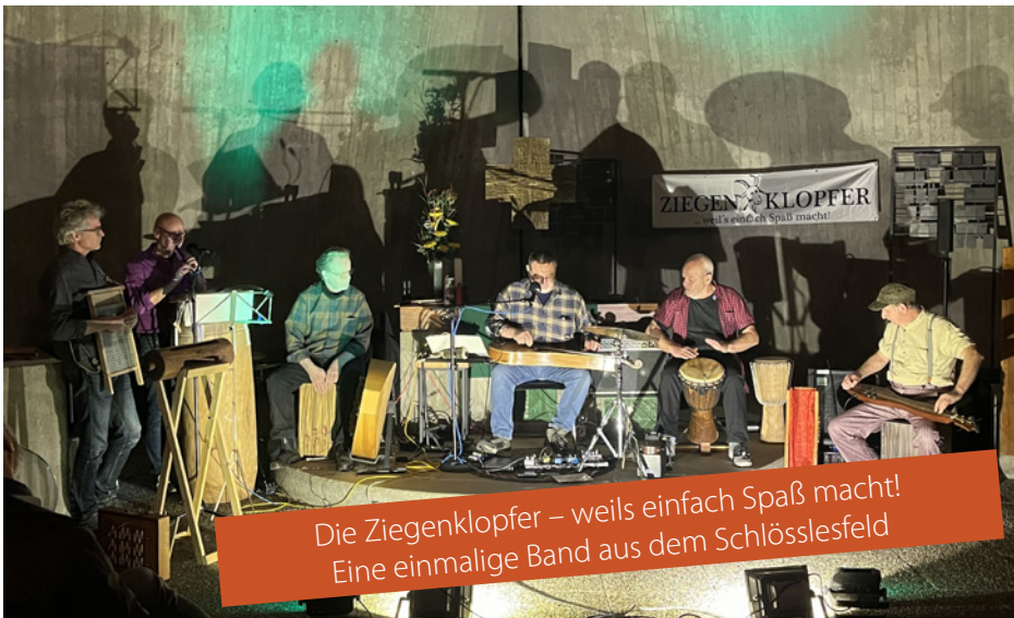
Die Ziegenklopfer – weils einfach Spaß macht! Eine einmalige Band aus dem Schlosslesfeld