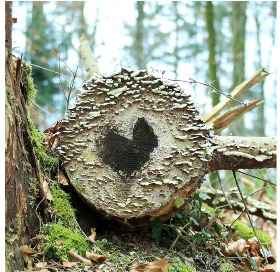
Ein Herz- das Symbol für die Liebe- entdeckt auf einem Spaziergang im Stromberg.

In diesem Rat steckt viel Weisheit. Denn Liebe braucht Wachsamkeit. Offenheit, um wahrzunehmen, was wer braucht und was wie wichtig ist. Sie braucht Ohren, die hören und Augen die sehen, ein weites Herz und einen wachen Verstand, um alles zu verstehen. Wer dem Aufruf von Paulus folgen will, braucht Mut, um sich zu entscheiden, was der nächste Schritt sein könnte, was das Beste für alle