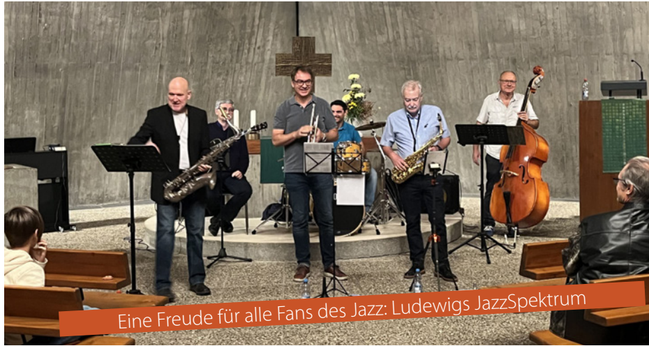
Eine Freude für alle Fans des Jazz: Ludewigs JazzSpektrum

Unsere Benefizkonzerte für den Bau unseres Gemeindehauses waren alle drei wirklich super. Wir hatten drei sehr abwechslungsreiche und wunderbare Abende!! Vielen herzlichen Dank all den Musikern und Musikerinnen!