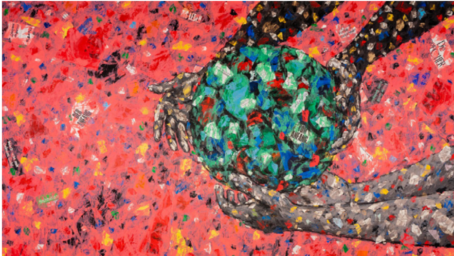
Das Misereor-Hungertuch 2023 „Was ist uns heilig?“ von Emeka Udemba.

Bildbetrachtungen zum Misereor Hungertuch des afrikanischen Künstlers Emeka Udemba